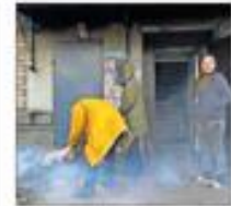
Ciudadanos en Bajmut, ayer.

contrario, el PSOE logró aprobar el dictamen de la futura ley de bienestar animal dejando fuera a los perros de caza pese a la resistencia inicial de Unidas Podemos. PÁGINAS 16 y 20 CONTINUA EN LA PÁGINA 12