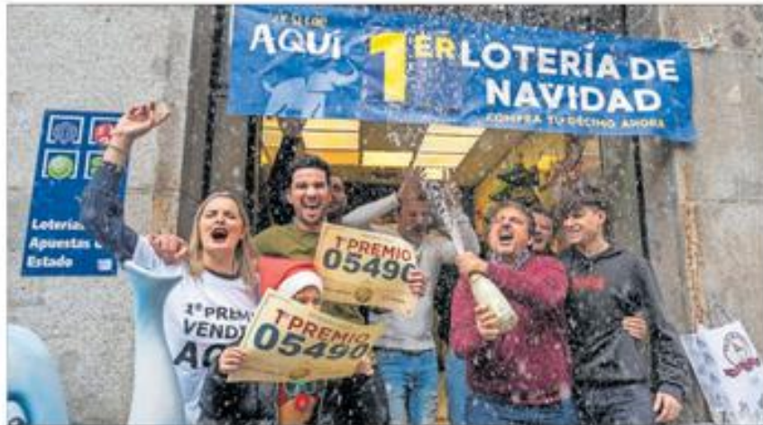
Los trabajadores y dueños de una administración de lotería en la calle Aníbal de Madrid celebraban ayer haber vendido el primer premio...