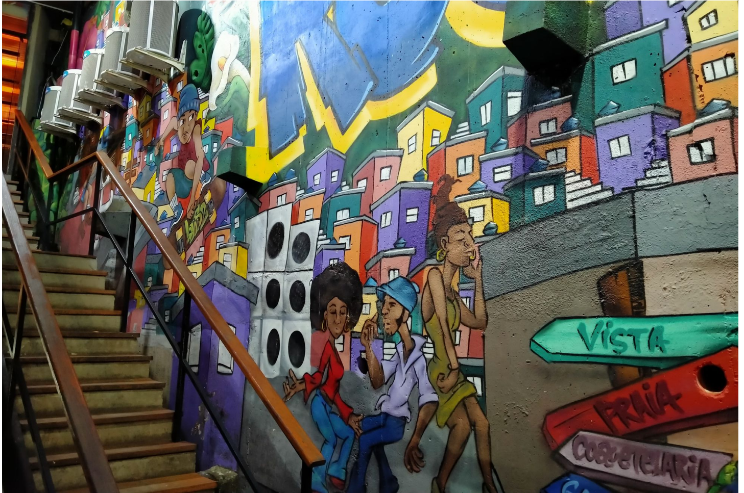
Graffiti en favela Rocinha que cuenta la historia de la comunidad.