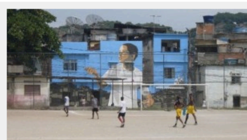
El actual Gobierno de Río de Janeiro hace grandes esfuerzos para pacificar las favelas a través de las UPP (Unidades de Policía Pacificadora) con proyectos innovadores.